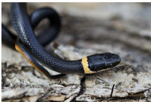
Une couleuvre à collier du Nord.

Vous pouvez signaler vos observations à Amphibia-Nature qui confirmera l'identification de l'espèce et pourra répondre à vos questions. Tout signalement, récent ou passé, est pertinent s'il est accompagné d'une photo, d'une date et d'un lieu d'observation. Ces données permettront d'accroître nos connaissances sur la répartition des espèces et seront utiles à des fins de conservation des habitats et de sensibilisation du public.