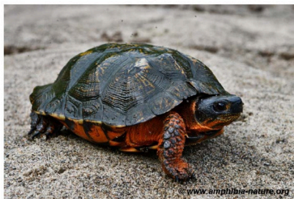
Une tortue des bois en déplacement.